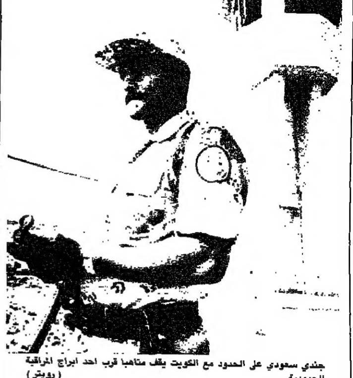
جندي سعودي على الحدود مع الكويت يقف متأهباً قرب أحد أبراج المراقبة الحدودية

اعلن المتحدث باسم وزارة الداخلية، ان الشرطة الفرنسية احتجزت اربعة طيارين في سلاح الجو العراقي حاولوا مغادرة فرنسا.